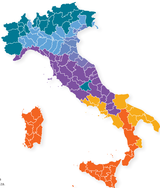
Immagine a solo scopo indicativo, chiedere sempre la zona climatica al proprio Comune di appartenenza.